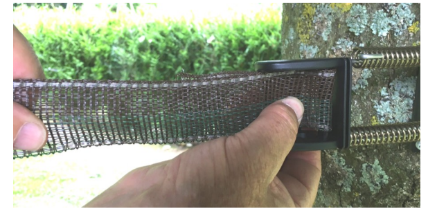
Press the two sections of tape together at the bottom of the buckle. The end of the tape is in the back. Poussez les 2 parties du rubans bien au fond de la boucle. La fin du ruban est à l'arrière.