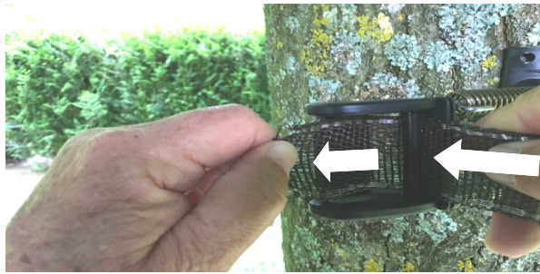
Now insert the tape back through the bigger slot Repasser le ruban dans la plus grosse fente