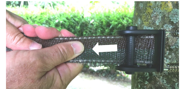
Pull the 2 tape sections together ... Tirer sur les 2 rubans ...