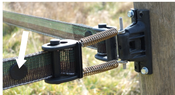
Use one round clip so the tape doesn't slip. Placer un CLIP punaise pour attacher les rubans