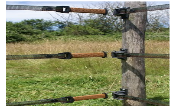
For easy manipulations 3 strands of tape is a maximum Pour faciliter les manipulations 3 rangées est un maximum