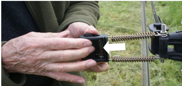
Pull the pin roller to slide and pinch the tapes Tirer le rouleau pour pincer les 2 rubans