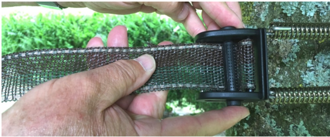
Insert the pin roller at the front of the 2 layers of tape Insérez le rouleau au devant des 2 épaisseurs de rubans